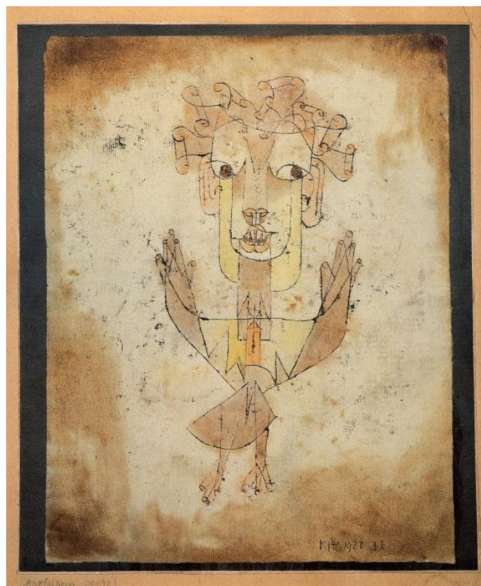
Quadro ad acquarello di Paul Klee

Un lavoro, quello dello svelamento, lungo e approfondito, necessario in quanto la posta in gioco è molto alta. In termini di sopravvivenza, di convivenza e di giustizia sociale, di denuncia e di