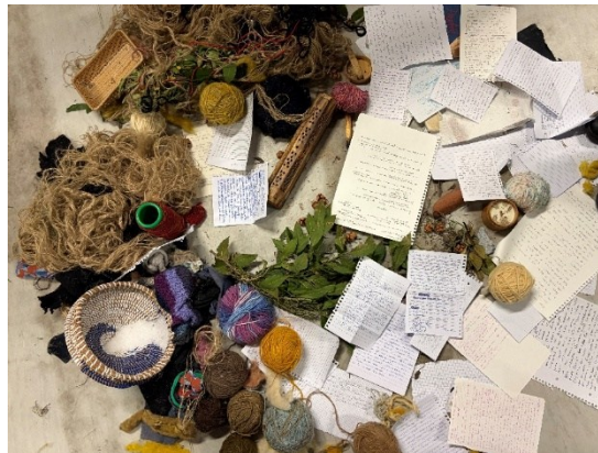
Foto 9: gli elementi e gli scritti autobiografici delle due giornate